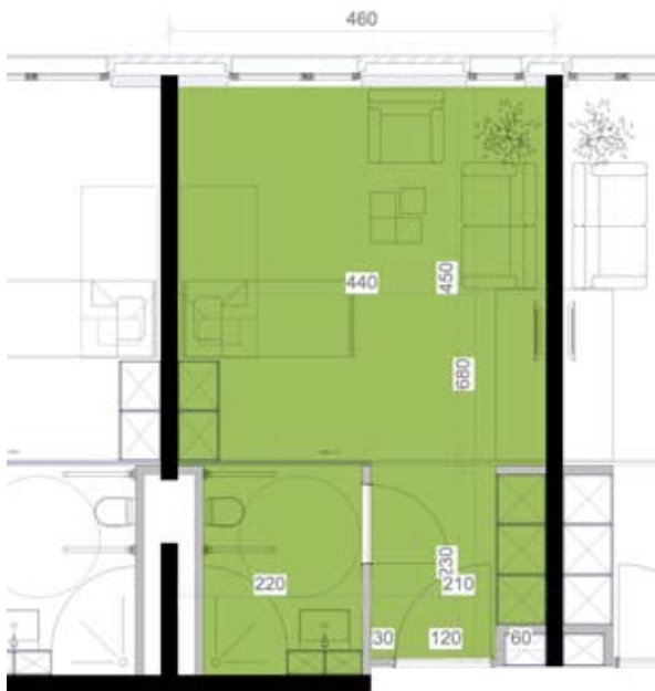
RUSTHUISKAMER Netto oppervlakte 29m 2