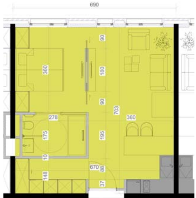
ASSISTENTIEWONING Netto oppervlakte 46m 2